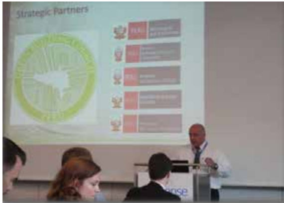
Congreso Mundial de Construcción Verde en Stuttgart-Alemania.