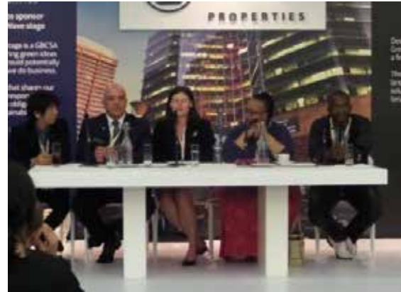
Congreso Mundial de Construcción Verde Ciudad del Cabo, Sud África.