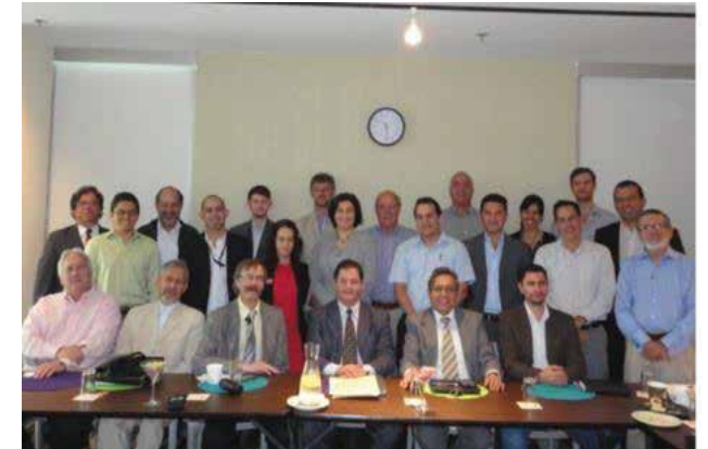
Desarrollando la hoja de ruta del NAMA para el desarrollo de la vivienda social baja en carbono.